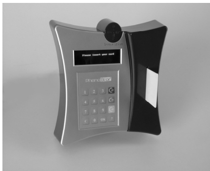
Abb. 3: PhenoStor ® -Kartenlese-Einheit

Die am weitesten fortgeschrittene Umsetzung der holographisch beschreibbaren Polymere als Datenspeicher stellt derzeit PhenoStor ® dar. Die möglichen Einsatzfelder beschränken sich nicht auf den ID-Check, also der Authentisierung oder Identifizierung von Personen [Bund05], [Icao03]. Auch die Gesundheits- oder übergreifende Bankkarte werden als nahe liegende Anwendungen betrachtet. Umfassende Patienten- bzw. Kundendaten lassen sich, wirksam gegen Datenmissbrauch oder -diebstahl geschützt, auf einer PhenoStor ® -Speicherkarte ablegen und autorisierten Benutzergruppen zur Verfügung stellen: Das Röntgenbild für den Radiologen, die Blutdruckwerte für den Internisten, Adresse und Geburtsort für die Krankenkasse können getrennt gespeichert und abgefragt werden. [Bmgs05]. Ähnlich verhält es sich beim Stand des Girokontos bei Bank A gegenüber den Informationen über die Sparbucheinlagen bei Bank B, die voneinander getrennt sein müssen.