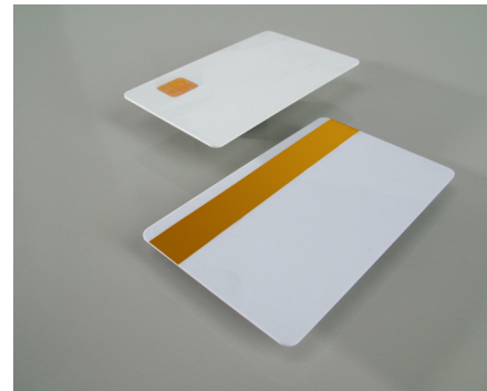
Abb. 2: PhenoStor®-Kartenrohlinge

Durch die flexible Verwendbarkeit des Materials eignet sich der neue Speicher für kombinierte Dokumente, die sowohl auf Biometrie als auch auf klassischen Identifizierungskriterien (Foto, Unterschrift) beruhen. Dazu zählen Reisepässe, Personalausweise, Führerscheine oder Zugangskarten für den Arbeitsplatz [Henn06], [Abb. 2].